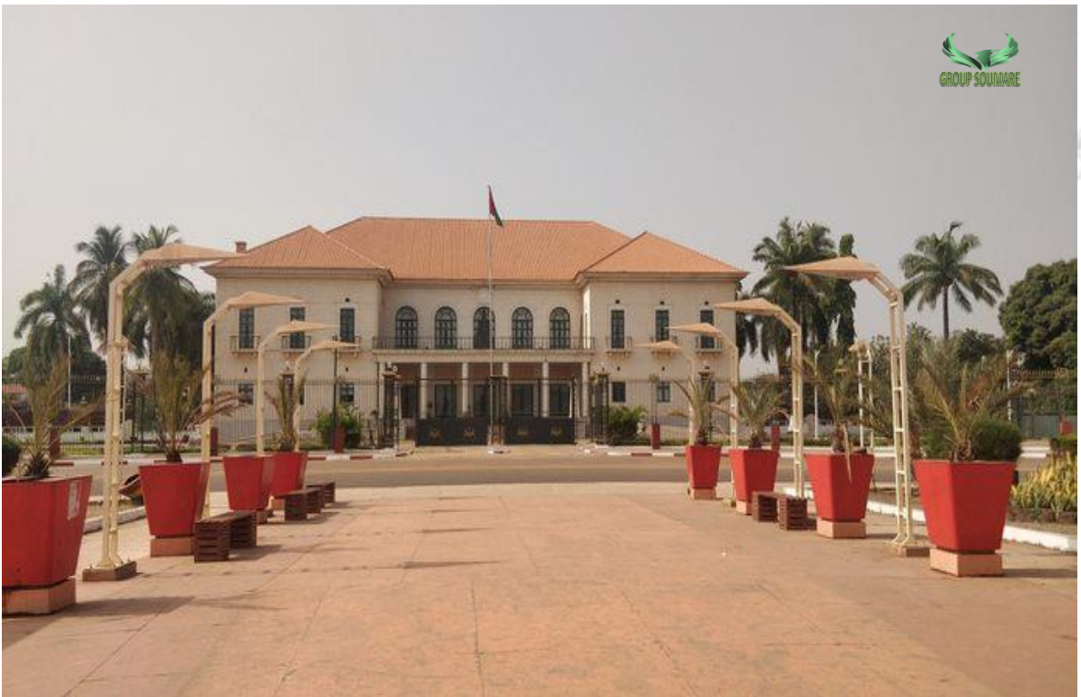
Palais présidentiel de Guinée