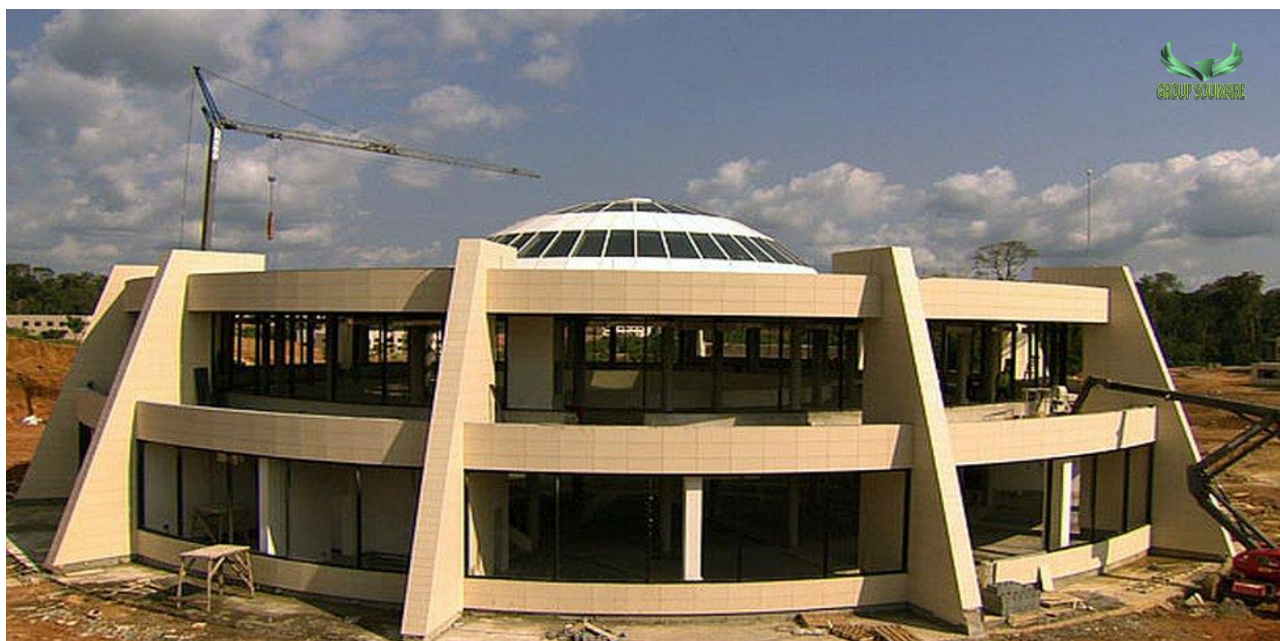
Théâtre National, Conakry Guinée